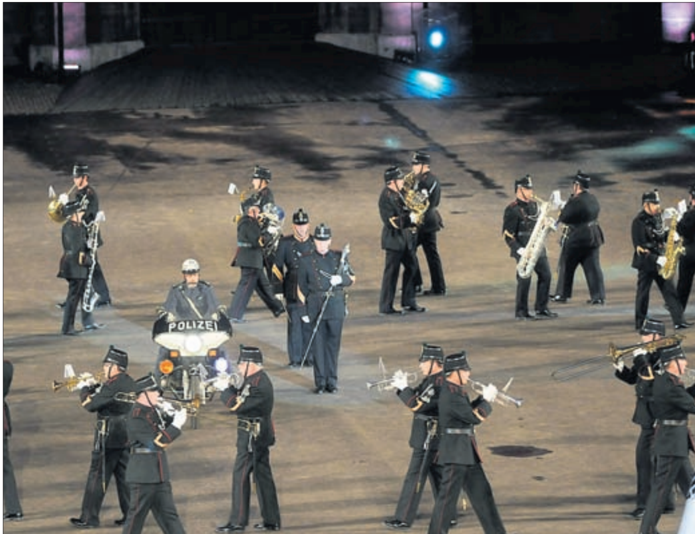
GELUNGEN Die Proben haben sich gelohnt: Die Polizeimusik Basel weiss mit ihrem Auftritt zu überzeugen. HEINZ DÜRRENBARGER

All das in den nagelneuen historischen Uniformen samt Schwert, die exakt jenen nachgebildet sind, mit welchen die Schugger vor 100 Jahren in unserer Stadt für Recht und Ordnung sorgten.